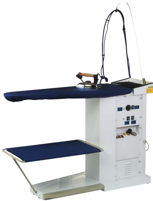
Table à repasser - chauffante - aspirante