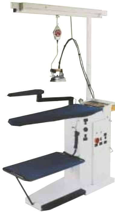
Table à repasser - chauffante - aspirante